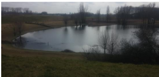
Duivelswaai: ooit ontstaan door een dijkdoorbraak tgv opstuwende ijsschotsen

In de uiterwaarden heb je kans om grazers als Rode Geus-runderen en Konikpaarden tegen te komen.