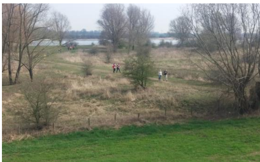
Impressie foto van voorgaande BBB editie

Tot 15:00 uur blijft de organisatie op zijn post en kun je je afmelden bij de Weeropper en daar nog even nagenieten op het terras.