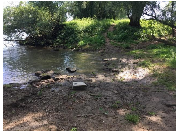
Uiterwaarden ten westen van het pontje

Over strand en door de uiterwaarden met karakteristieke plekjes. Steenfabriek, poelen en waterplassen en ooibos.