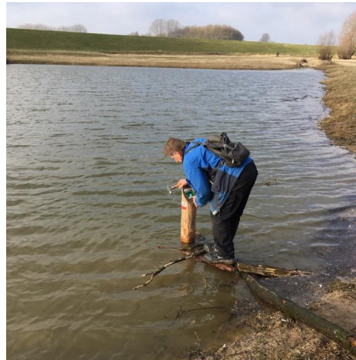
De bewegwijzering aanbrengen was niet altijd even eenvoudig

Openingstijden: 0487-524274 -0653702952. Je kunt daar ook overnachten in de B&B en vandaar uit het klompenpad wandelen. Adres: Batenplak 2, Ewijk. reserveringen@vanzuilenewijk.nl