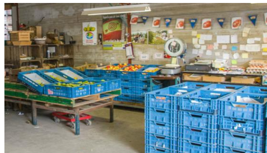
In de boerderijwinkel kun je terecht voor fruit, sap en streekproducten.