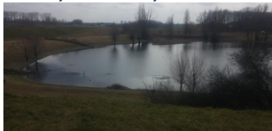
Duivelswaai: ooit ontstaan door een dijkdoorbraak tgv opstuwende ijsschotsen

Beleef Beuningen Buiten heeft ook cultuur te bieden. Je wandelt langs Slot Doddendael (dat vermoedelijk al uit de veertiende eeuw stamt), historische boerderijen en landhuizen en typische arbeiderswoningen die bij de steenoven hoorden. Overal langs de route zie je de kenmerken van de eeuwenoude strijd tussen de mens en het water, zowel binnendijs als buitendijs.