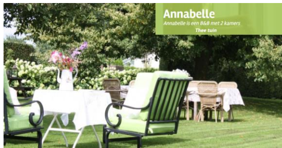
Annabelle Annabelle is een B&B met 2 kamers Thee tuin

Welkom voor een kopje koffie, lunch / overnachting.