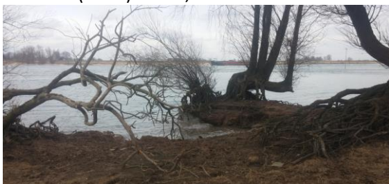
Waalstrand: uitgespoelde kant waardoor boomwortels bloot komen

Vanuit Beuningen gaat de tocht bijna alleen maar door het buitengebied. Alleen in het dorpje Winssen loop je in een bebouwde omgeving. Je wandelt door de uiterwaarden, over het (Waal)strand,