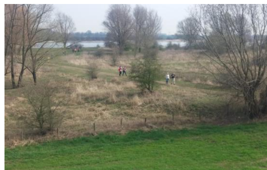
Impressie foto van voorgaande BBB editie

De tweede is na ca 18,5 km bij Gasterij de Arend te Winssen, voor eten en drinken. Op start/finish bij de Weeropper is er een terras en zijn er streekproducten te koop in de boerderijwinkel.